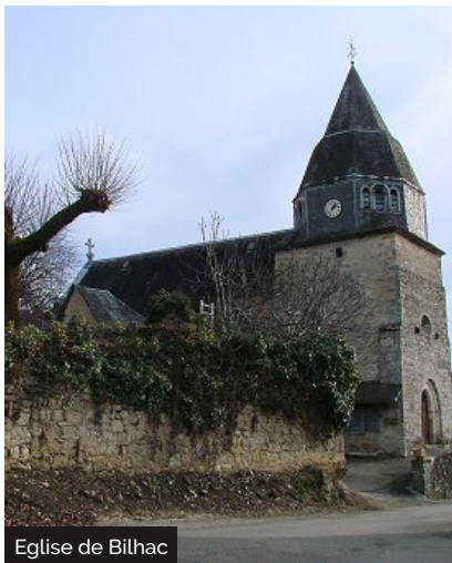
Eglise de Bilhac