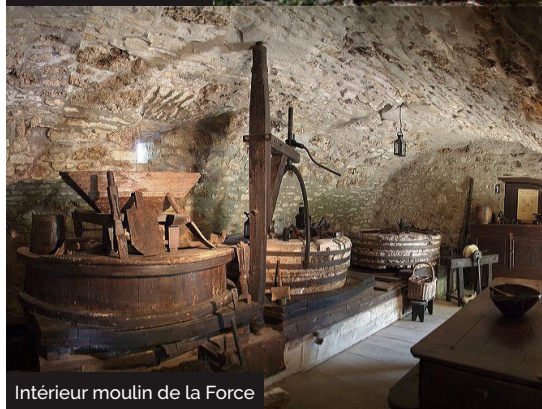
Intérieur moulin de la Force

Embarquez vos randonnées en téléchargeant l'appli Vallée de la Dordogne - Tour sur iPhone, l'iPad et l'iPod touch