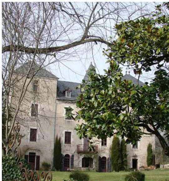
Château de Bilhac

Au moyen âge, le bourg rassemblé autour de l'église et du château, était directement soumis au vicomte de Turenne. Cette forteresse était destinée sans doute à la surveillance de la vallée du Palsou et de la route du Puy d'Arnac au Port de Hol, près de Tauriac. Le ruisseau de Palsou comptait cinq moulins à grains, trois en Corrèze et deux dans le Lot. Le moulin de la Force conserve aujourd'hui sa meunerie voûtée avec trois meules et la potence, ainsi que le bassin de retenue d'eau (dérivation du Palsou) et les turbines à ailettes placées horizontalement dans le flux de l'eau directement.